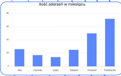
Ilość zdarzeń w miesiącu